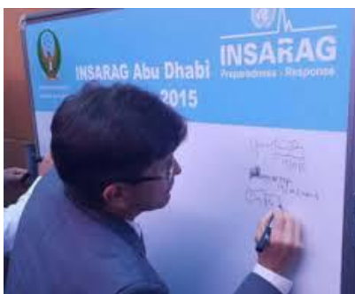
Foto: En el 2015 la XIV Reunión de las Américas de INSARAG se realizó en el marco de la Reunión Mundial INSARAG en Abu Dabi.

La versión XV se realizará en Colombia como sede e invita el Director General de la Unidad Nacional para la Gestión del Riesgo de Desastres de Colombia (UNGRD), en su calidad como Presidente del Grupo Asesor Internacional de Operaciones en Búsqueda y Rescate (INSARAG por sus siglas en inglés) en las Américas, del 16 al 18 de noviembre en la ciudad de Bogotá. Es organizada conjuntamente con la Oficina de Coordinación de Asuntos Humanitarios de las Naciones Unidas (UN OCHA), en su calidad de Secretaría del INSARAG y administradora del sistema UNDAC.