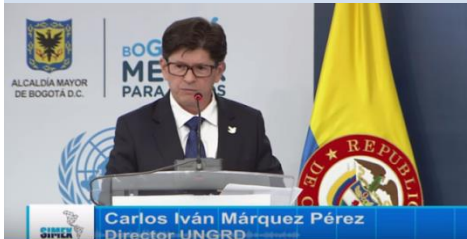
Foto: Presidente Regional de INSARAG inauguración SIMEX. 26 septiembre 2016, Bogotá