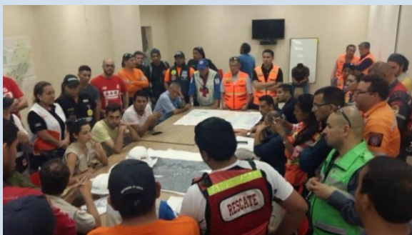
Foto: Reunión de coordinación equipos USAR Nacionales – 17 abril 2016 Portoviejo, crédito: @Riesgos_Ec - Ecuador

Sin embargo, el terremoto ocurrido a pesar de dejar muchas pérdidas y daños, es una oportunidad para revisar y replantear protocolos y procedimientos, que permitan que la respuesta nacional e internacional ante un futuro evento sea más eficaz y oportuna, teniendo como objetivo principal el salvar el mayor número de vidas e incluso ir “más allá de los escombros”, prestando ayuda internacional especializada que el país considere necesaria en el momento.