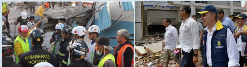
Foto: Equipos USAR – 18 abril 2016 Portoviejo

En conclusión, se puede decir que Ecuador fue un escenario importante para valorar las grandes fortalezas que tenemos para encontrar los puntos a mejorar y por supuesto queda pendiente una evaluación con Ecuador para que oficialmente quede algo establecido y de replicar en el banco de estudio de casos y experiencias exitosas en nuestra web de www.insarag.org .