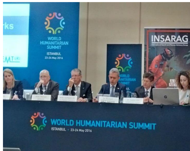
Foto: Presidente Regional de INSARAG en Cumbre Mundial Humanitaria. 23 mayo 2016, Estambul