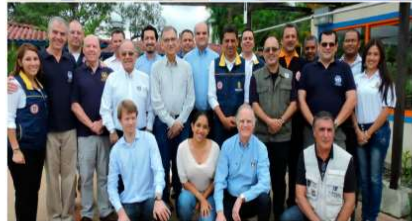
Equipo de trabajo en taller de Grupos de Búsqueda y Rescate Urbano de las Américas

Reto 2017: Presentar la propuesta en la reunión del grupo directivo en Ginebra, en febrero de 2017.